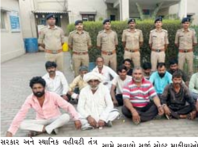
સરકાર અને સ્થાનિક વહીવટી તંત્ર સામે સવાલો સર્જી સોલ્ટ માફિયાઓ