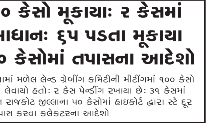
લેન્ડ ગ્રેબીંગ કમિટી: ૧૦૦ કેસો મૂકાયા: ૨ કેસમાં ફોજદારી થશે: ૩૧માં સમાધાન: ૬૫ પડતા મૂકાયા હાઇકોર્ટનો સ્ટે દુર થતા ૫૦ કેસોમાં તપાસના આદેશો

રાજકોટ જીલ્લા કલેક્ટર શ્રી પ્રભવ જોષીની અધ્યક્ષતામાં મળેલ લેન્ડ ગ્રેબીંગ કમિટીની મીટીંગમાં ૧૦૦ કેસો મૂકાયા હતાં. તેમાંથી ૨ કેસમાં ફોજદારીનો નિર્ણય લેવાયો હતો: ૨ કેસ પેન્ડીંગ રખાયા છે: ૩૧ કેસમાં સમાધાન થયું છે: ૬૫ કેસો પડતા મૂકાયા: દરમિયાન રાજકોટ જીલ્લાના ૫૦ કેસોમાં હાઇકોર્ટ દ્વારા સ્ટે દુર કરાતા આ તમામ કેસોમાં તપાસ કરવા કલેક્ટરના આદેશો