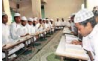
અમદાવાદ, તા. ૧૮: રાજ્યમાં આવેલી ૧૧૩૦ જેટલા મદરેસાઓનો સર્વે કરવા શિક્ષણ વિભાગ દ્વારા આદેશ કરવામાં આવ્યો છે. રાષ્ટ્રીય બાળ અધિકાર સંરક્ષણ આયોગ સમક્ષ મદરેસાઓમાં અભ્યાસ કરતા બાળકોને લઈને ફરિયાદ મળ્યા બાદ રાજ્યના શિક્ષણ વિભાગ દ્વારા મદરેસાઓનો સર્વે કરવા આદેશ કરાયો છે. મદરેસાઓમાં ભણતા બાળકો સામાન્ય સ્કૂલોમાં અભ્યાસ કરતા ન હોવાથી સર્વેમાં વિગતો એકત્ર કરાશે. આ ઉપરાંત રાજ્યના મદરેસાઓમાં અભ્યાસ કરતા બિન મુસ્લિમ બાળકોની વિગતો પણ મેળવવા માટે જણાવ્યું છે. આ માટે DEO અને DPEO દ્વારા ટીમ બનાવી મદરેસાઓમાં ભૌતિક ચકાસણી કરવામાં આવશે. સંબંધિત એક જ દિવસમાં મદરેસાઓનો સર્વે પૂર્ણ કરી તે અંગેનો અહેવાલ સુપરત કરવામાં આવનાર હોવાનું જણાવ્યું છે.

રાષ્ટ્રીય બાળ અધિકાર સંરક્ષણ આયોગ સમક્ષ મદરેસાઓને લઈને ફરિયાદ મળ્યા બાદ તપાસ કરાશે વર્ષના બાળકોને મક્કત અને ફરિયાદ શિક્ષણના કાયદાનો ભંગ થાય છે. આવા બાળકો સામાન્ય સ્કૂલોમાં પણ પ્રવેશ મેળવી અભ્યાસ કરે તે માટે સર્વે હાથ ધરવામાં આવી રહ્યાં છે. ઉપરાંત મદરેસાઓમાં અભ્યાસ કરતા બિન મુસ્લિમ વિદ્યાર્થીઓની વિગતો પણ સર્વેમાં એકત્ર કરવા માટે આદેશ આપવામાં આવ્યો છે. આમ, મદરેસાઓના સર્વેને લઈને રાજકીય માહોલ ગરમાય તેવી પણ શક્યતાઓ છે.