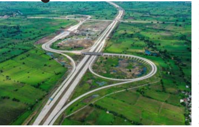
હાલમાં, આ અંતર કાપવામાં લગભગ ૩૫ કલાકનો સમય લાગે છે. જેને ઘટાડીને

નવી દિલ્હી, તા.૧૮ : દિલ્હી-વડોદરા-મુંબઈ એક્સપ્રેસ-વે ભારતનો સૌથી લાંબો એક્સપ્રેસ-વે પ્રોજેક્ટ છે અને તેની કુલ લંબાઈ ૧,૩૫૦ કિમી છે. પરંતુ હવે સુરત-ચેન્નઈ એક્સપ્રેસ-વે ૧,૨૭૧ કિમી લાંબો દેશનો બીજો સૌથી લાંબો એક્સપ્રેસ-વે તૈયાર થઈ રહ્યો છે. આ એક્સપ્રેસ-વે પશ્ચિમ ઘાટ દ્વારા ચેન્નઈથી સુરતને જોડવા જઈ રહ્યો છે. નવા એક્સપ્રેસ-વેનું નિર્માણ કાર્ય આગામી બે વર્ષમાં પૂર્ણ થવાની અપેક્ષા છે.