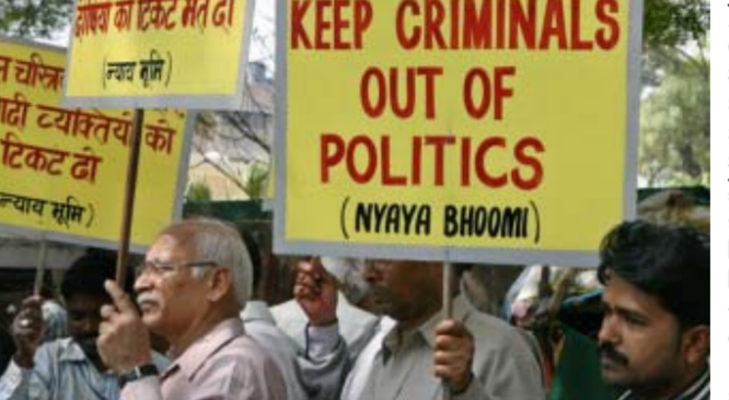
૪૪ ટકાનો વધારો થયો છે. કુલ ૧૯૮ સાંસદ એવા હતા, જેમની સામે વર્ષ ૨૦૧૯ની લોકસભાની ચૂંટણીમાં હત્યા, હત્યાના પ્રયાસ, અપહરણ, એક્સપ્રેસ-વેના નિર્માણનો અંદાજિત ખર્ચ ૫૦,૦૦૦ કરોડ રૂપિયા છે : હાલમાં એક્સપ્રેસ-વેના લેન સાથે બનાવવામાં આવી રહ્યો છે : જેને ભવિષ્યમાં છ લેન અથવા આઠ લેન એક્સપ્રેસ વેમાં રૂપાંતરિત કરી શકાય છે

બન્યો છે. અપરાધ અને રાજકારણ વચ્ચે ઘનિષ્ટ મિત્રતા જોવા મળે છે. દેશમાં સંસદમાં ચૂંટાયેલા ગુનાઈત ઉમેદવારોની સંખ્યા વર્ષ ૨૦૦૪થી સતત વધતી જાય છે. દેશમાં ૨૦૦૪માં ૨૪ ટકા સાંસદ એવા હતા, જેમના પર ગુનાઈત કેસો પેનિંગ હતા. એ સંખ્યા વધીને ૨૦૧૯માં લગભગ બમણી વધીને ૪૪ ટકાએ પહોંચી હતી. વર્ષ ૨૦૦૮માં લોકસભામાં ૩૦ ટકા સાંસદો પર ગુનાઈત કેસો પેનિંગ હતા, જે વર્ષ ૨૦૧૪ની લોકસભામાં વધીને ૩૪ ટકાએ પહોંચી હતી. વર્ષ ૨૦૨૩ના ફેબ્રુઆરીમાં દાખલ કરવામાં આવેલી એક અરજીમાં એ વાત પર દાવો કરવામાં આવ્યો હતો કે વર્ષ ૨૦૧૯ પછી જાહેર ગુનાઈત કેસોવાળા સાંસદોની સંખ્યામાં